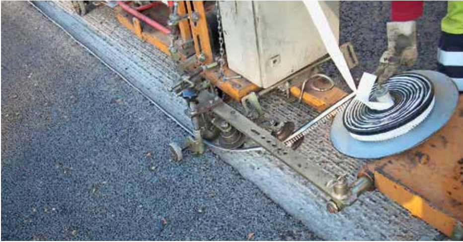
Abbildung 4: Maschineller Einbau des Bitumenfugenbands

trägt worden, weil auch Deckschichten aus Offenporigen Asphalten nicht immer (fugenlos) in voller Breite eingebaut werden können. Aus Kostengründen und weil nicht immer Verkehrssperrungen möglich sind, werden Deckschichten auch teilweise oder abschnittsweise erneuert, so dass gemäß den ZTV Asphalt-StB (6) die Verbindungsstellen zwischen den Asphaltbahnen vorzubehandeln sind. Wenn nicht im Verfahren „heiß an heiß“ eingebaut werden kann, sind „Nähte“ oder „Fugen“ auszubilden. Nähte können lediglich eine Verklebung bewirken, während Fugen Bewegungen aufnehmen können. Die Fugen können durch nachträgliches Schneiden und Vergießen oder durch das Einlegen eines Bitumenfugenbandes ausgebildet werden.