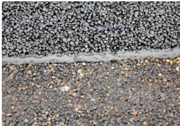
Abbildung 3: Mit Tok-Band SK Drain ausgebildete Fuge auf der A 9 bei Nürnberg

Ein Forschungsprojekt der RWTH Aachen untersuchte die Nahtausbildung bei Asphaltdeckschichten aus Offenporigem Asphalt (5). Die Untersuchung war beauf-